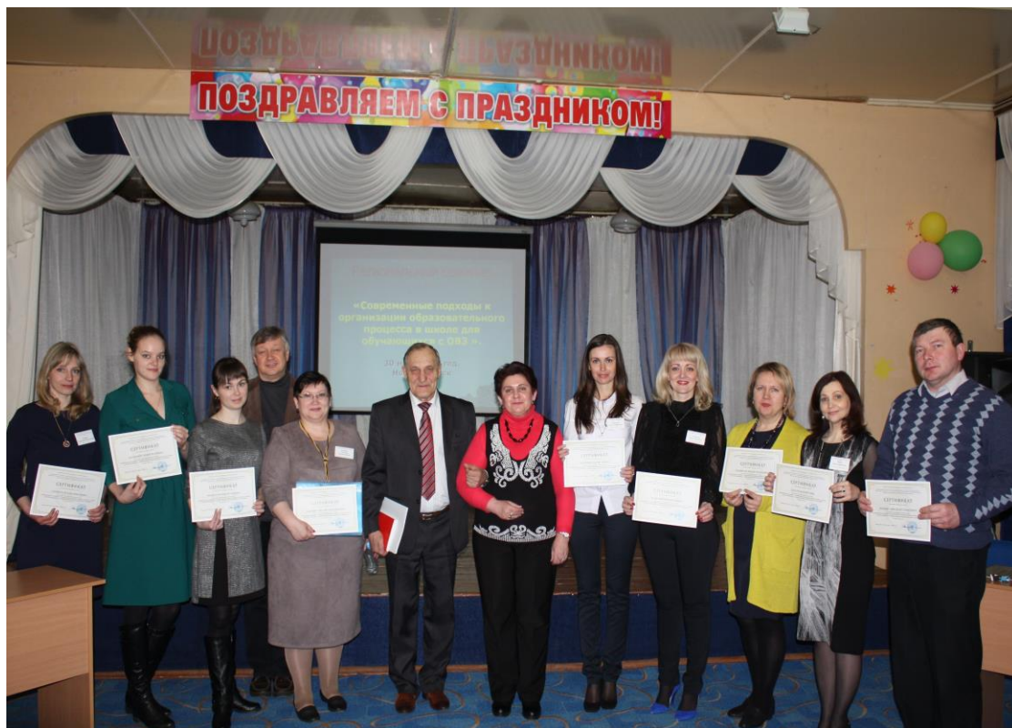
Рисунок 2. Участники регионального круглого стола.

7. Формирование коммуникативных навыков и толерантности у детей с ограниченными возможностями здоровья.