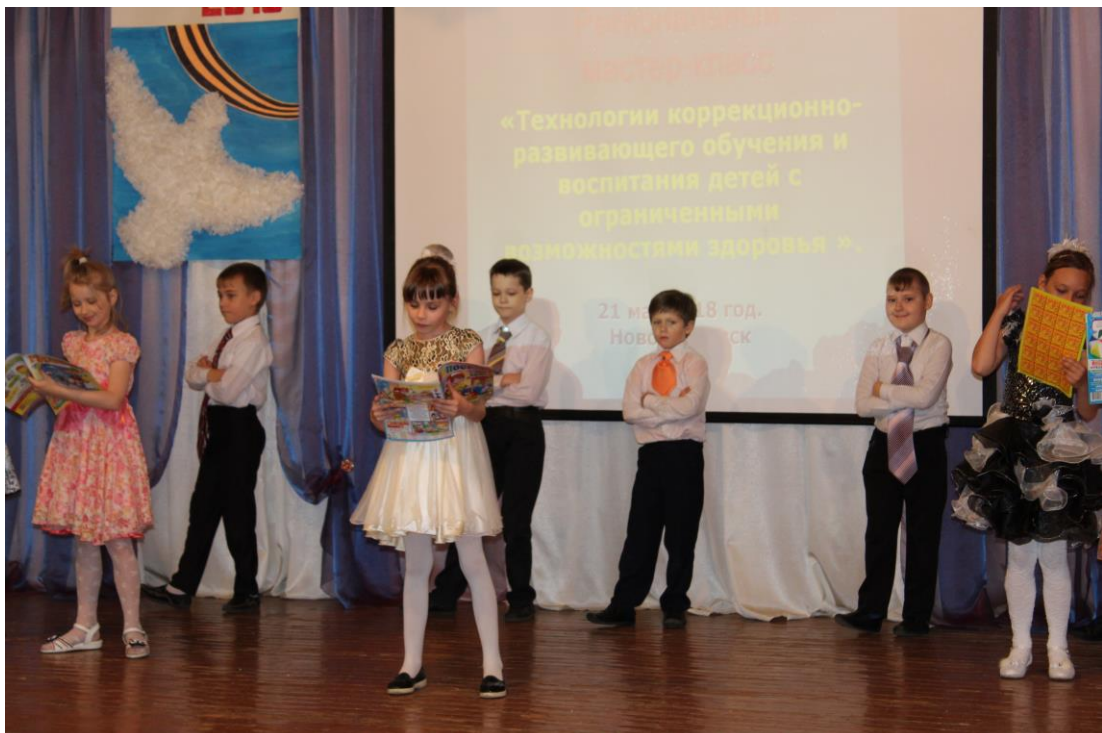
Рисунок 11. Участники регионального мастер-класса.