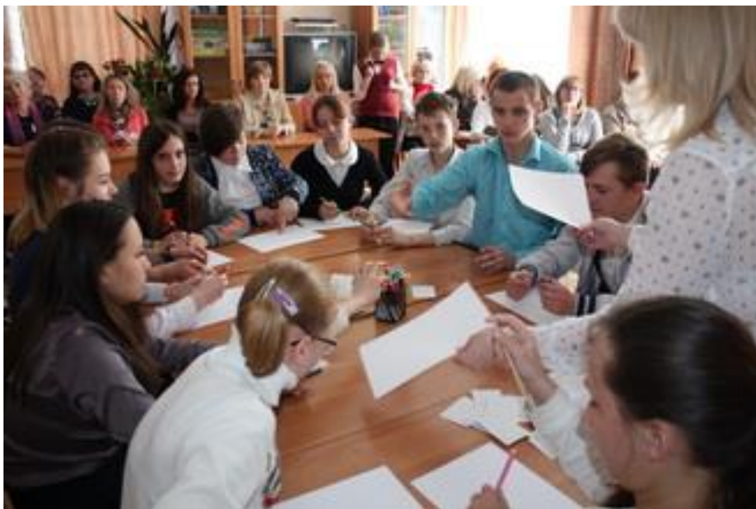
Рисунок 1. Участники регионального мастер-класса.