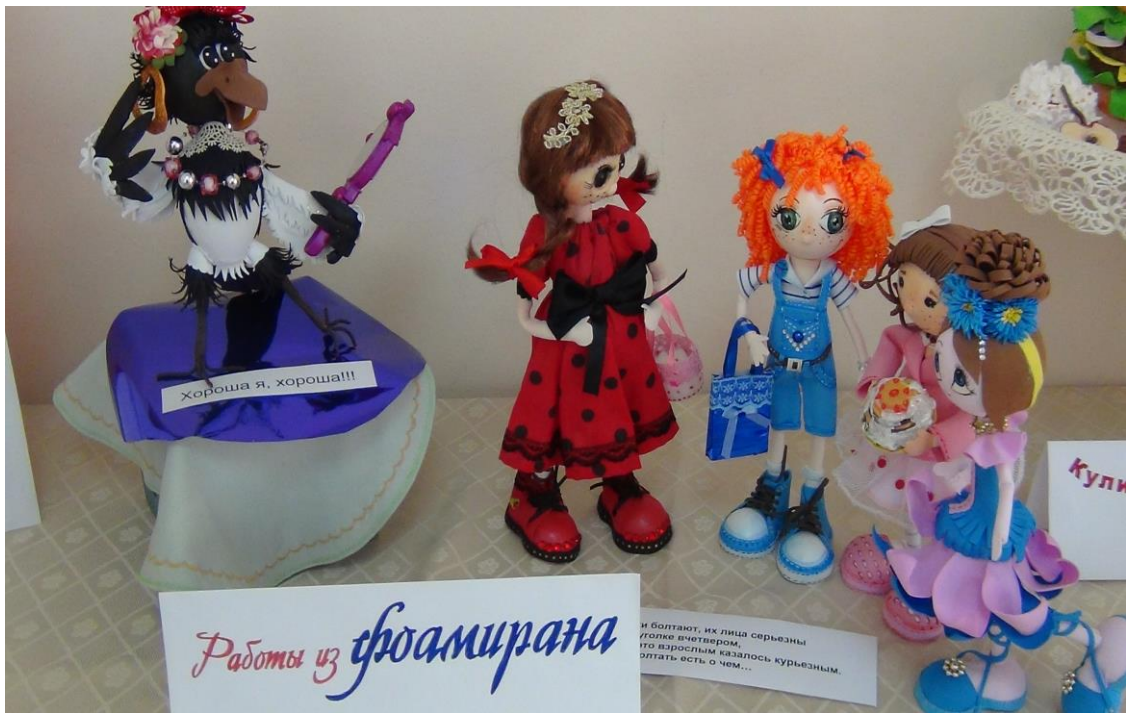
Рисунки 12, 13. Творческие работы детей с ограниченными возможностями здоровья.